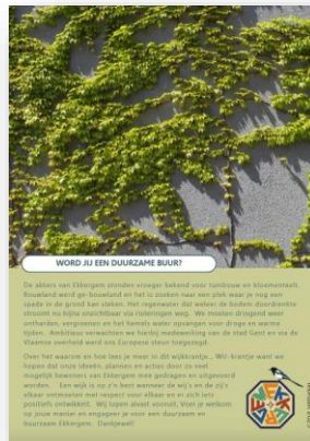
wijkkrant duurzaam Ekkerghem 23/1

februari 2023: Wijkkrant rond duurzaamheid (1 ste editie reeds gerealiseerd via subsidie SAZ)